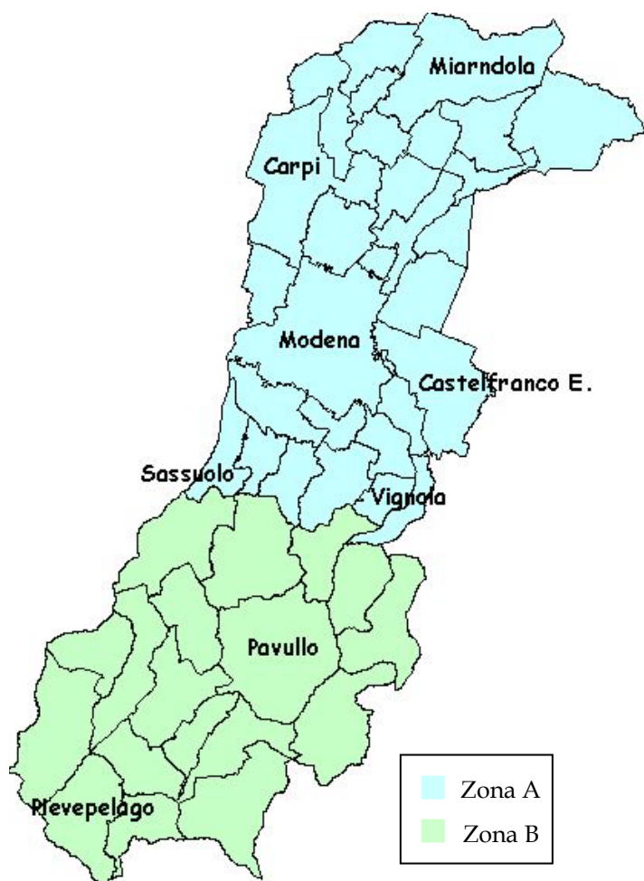
Fig. n° 1: Composizione delle Zone

Recentemente la Regione Emilia Romagna, anche a seguito dell'entrata in vigore del DM 261/02 che ha definito i criteri per la zonizzazione, ha fatto una nuova proposta che prevede la riduzione del numero di zone da tre a due (zona A e zona B): la zona A, che comprende i territori ad elevata attività antropica e i comuni limitrofi per cui è prevedibile un elevato sviluppo e dove c'è quindi il rischio di superamento dei valori limite, mentre la Zona B, che comprende i comuni in cui è presente o è prevedibile una media attività antropica e in cui i dati di qualità dell'aria risultano inferiori al valore limite.